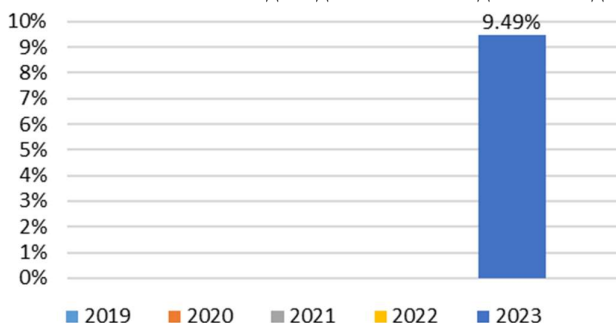
Постигната номинална доходност за последните 5 години

* „ПОД ДаллБогг: Живот и Здраве“ ЕАД представя данни за постигната номинална доходност само за 2023 г., тъй като тя е първата пълна календарна година от управлението на активите на фонда.